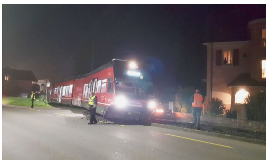
Bis um 16 Uhr mussten die Passagiere auf Ersatzbusse ausweichen. AB

Wer gestern Morgen um 7 Uhr mit der BTI-Bahn von Täuffelen her Richtung Biel fuhr, wurde spätestens in Gerolfingen richtig geweckt: Auf einem Bahnübergang kurz vor der Kreuzung Wagenerstrasse/Hauptstrasse ist die BTI-Bahn mit einem Auto kollidiert. Der vordere Teil der Bahn entgleiste. Die Passagiere mussten ein paar Minuten zu Fuss ins Dorfzentrum gehen und wurden dort von einem Ersatzbus abgeholt. Verletzt wurde niemand, auch der Autolenker nicht.